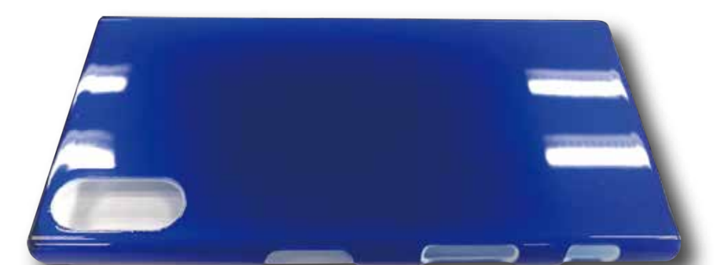
シルプラス®をコーティングした筐体