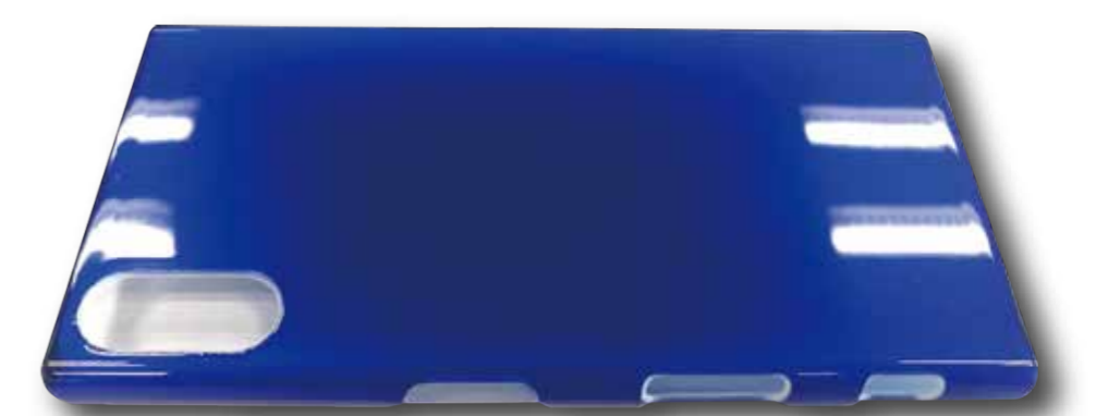
SILPLUS®をコーティングした筐体