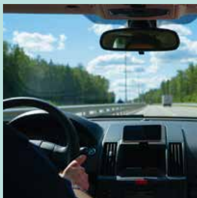
自動車用窓ガラス